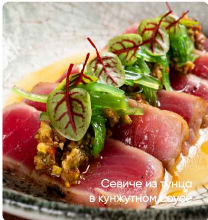
Севиче из тунца в кунжутном соусе