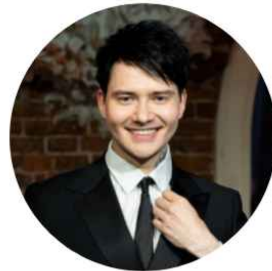
Роман SMM Специалист