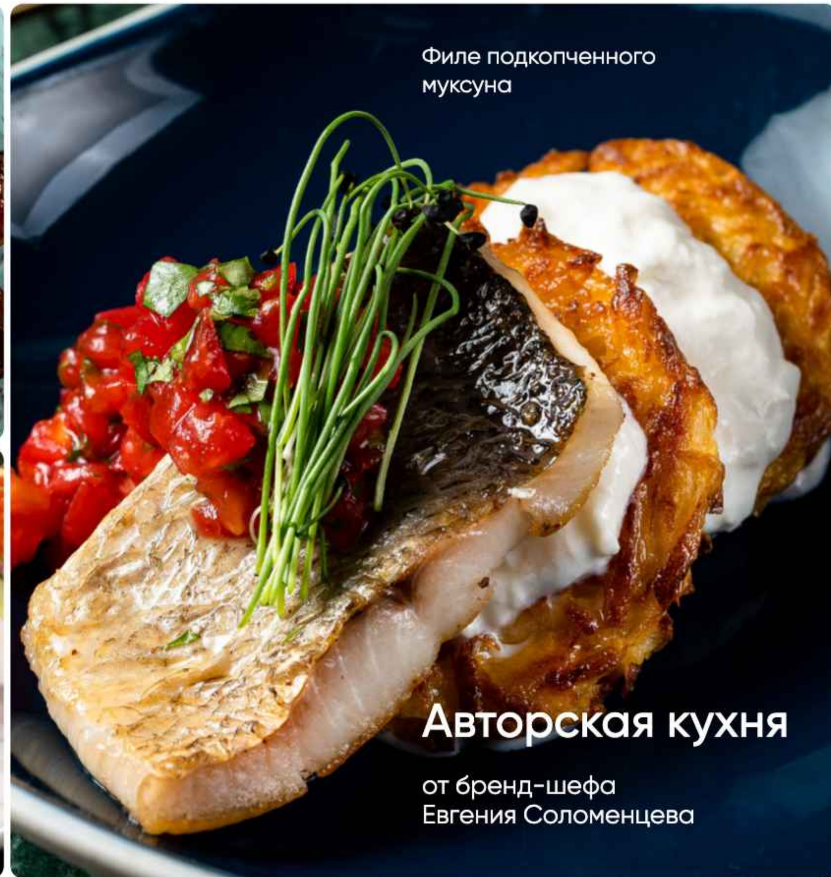
Филе подкопченного мукуна